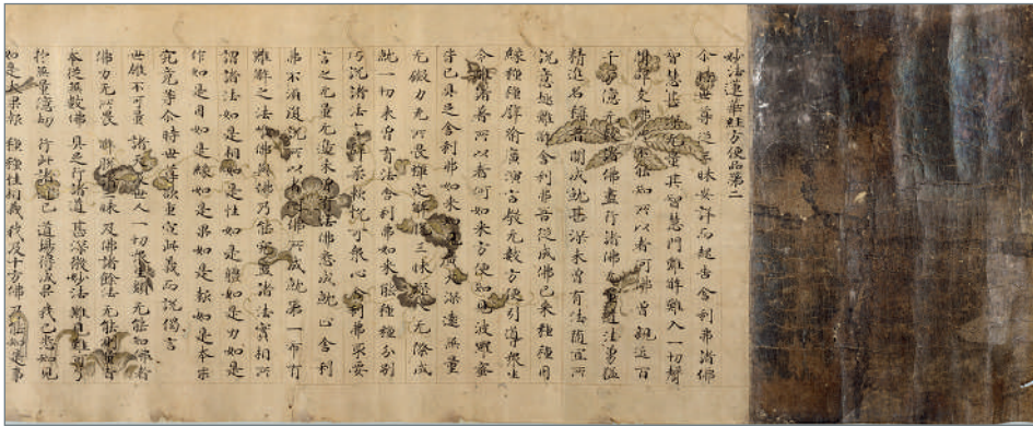
Minamoto Toshifusa (?), Lotus Sutra , capitolul despre „Mijloace oportune” (Chikubushima Sutra), secolul al XI-lea d. Hr., cerneală pe sul de hârtie, 29,6 x 528,5. Tokyo, National Museum, B-2401.