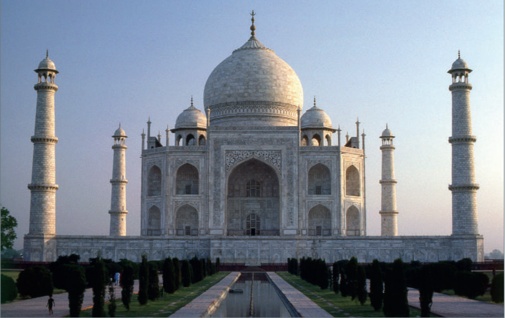
Taj Mahal, 1631–1648 d. Hr., Agra, India.