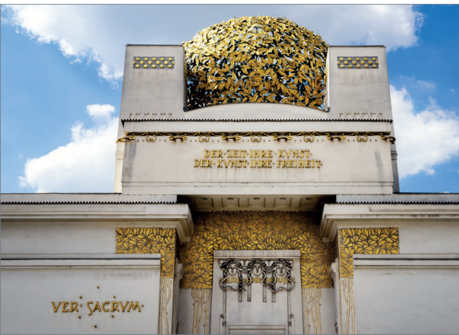
Clădirea Secession de la Viena (Austria), exemplu important de art nouveau Austriac din Karlsplatz.