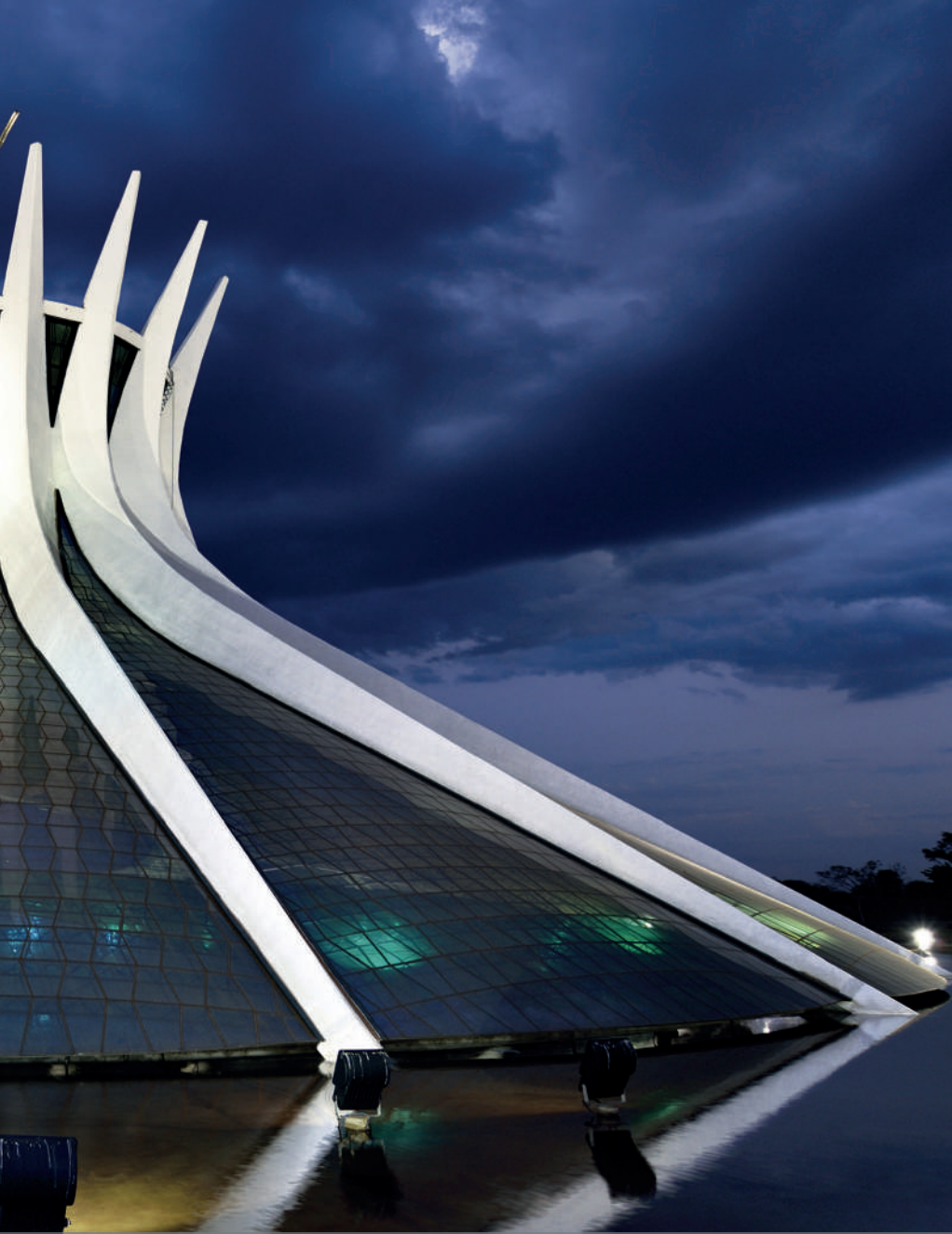
Oscar Niemeyer, Catedrala din Brasília, Brazilia, proiectată în 1958 d. Hr.