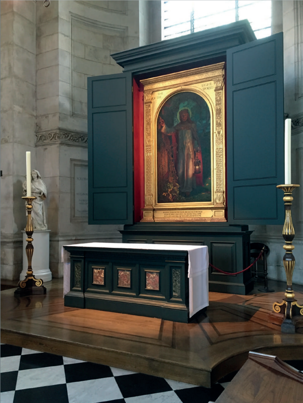
William Holman Hunt, Lumina lumii , 1900–1904 d. Hr., ulei pe pânză, 304,8 x 193 cm. St. Paul's Cathedral, London, given by the Right Hon Charles Booth.