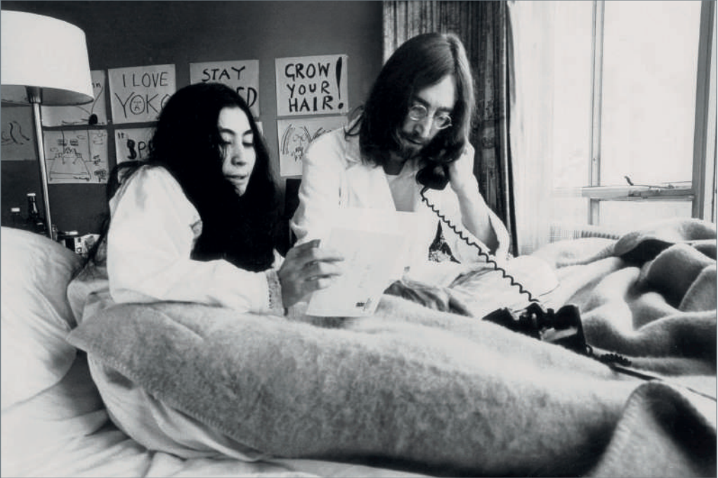
John Lennon și Yoko Ono la Hotelul Hilton din Amsterdam, 25 martie 1969 (fotografie alb/negru).