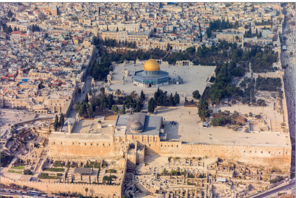
Israel-Palestina: o vedere aeriană a Muntelui Templului din estul Ierusalimului, privind spre nord, 2013 d. Hr.