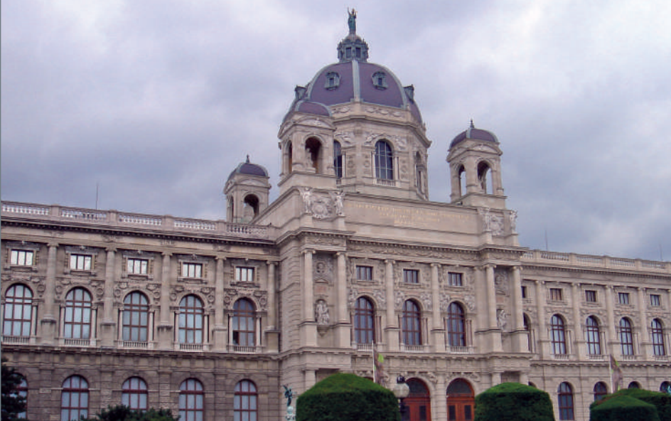
Vedere peste Maria-Theresien-Platz și Kunsthistorisches Museum, lângă Ringstrasse, 1860–1875 d. Hr., Viena, Austria.