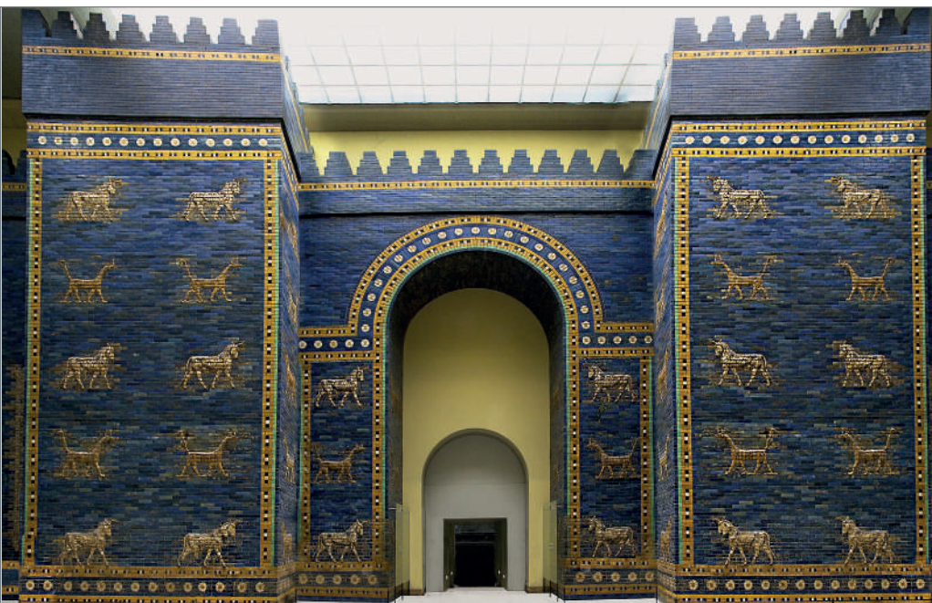
Reconstituire din anii 1930 a Porții lui Iștar de la Babilon din cărămizi originale, cca 575 î. Hr., executate la porunca lui Nabucodonosor al II-lea, lut ars glazurat. Pergamon Museum, Berlin, Germania.