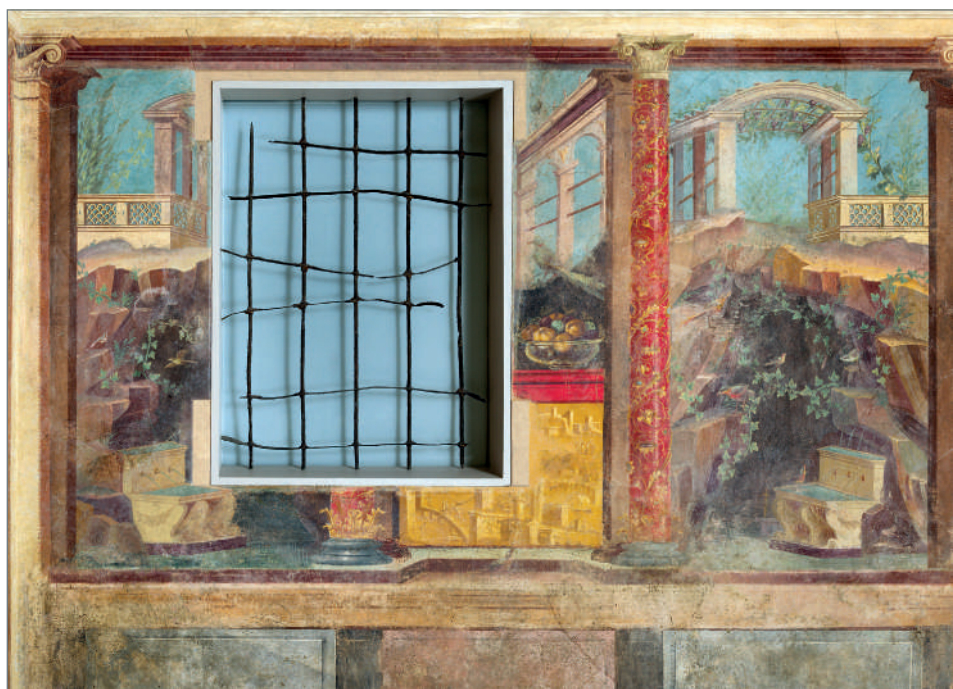
Zidul scurt din cubiculum (dormitor) de la Boscoreale, camera M din vila lui Publius Fannius Synistor, cca 50–40 î. Hr., frescă, 265,4 × 334 × 583,9 cm, Boscoreale, Pompei, Roma. Metropolitan Museum of Art, New York, Rogers Fund, 1903, 03.14.13a–g