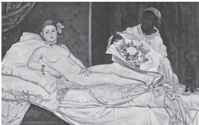
Édouard Manet, Olympia , 1865 d. Hr., ulei pe pânză, 130.5 x 191 cm. Musée d'Orsay, Paris, RF 644.

miezul ei lumea materială. Unii istorici nu se lasă convinși că obiectele, clădirile și imaginile furnizează dovezi utile ale trecutului. Își fac griji în ce privește subiectivitatea lor, în comparație cu cuvântul scris sau rostit. Însă o asemenea sursă obiectivă nu există, iar documentele nu sunt cu nimic mai puțin părtinitoare, sau mai subiective, decât oricare produs omenesc. Artă își câștigă puterea prin capacitatea de a ne aprinde și impulsiona emoțiile. Fiind capabilă să facă apel la ființa noastră interioară, ne poate oferi consolare și atașament, legându-ne de oameni și de trăiri departe de noi în timp și în spațiu. La fel cum dinspre latura emotivă este capabilă să ațâțe neînțelegerea și divergența de păreri, amplificându-ne stinghereala, furia sau violența. Crescând în Irlanda de Nord, în timpul Tulburărilor ( Troubles ), am devenit cât se poate de sensibilă la această chestiune. Artă este periculoasă și ne poate influența în maniere viguroase și uneori de necontrolat. Dar, în același timp, are calitatea unică de a ne apropia de oamenii și de lumile din trecut. Ținând în mână o