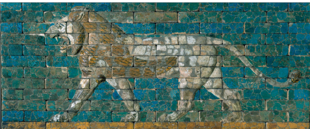
Panou cu leu în mers de pe Calea Procesiunilor, Babilon, cca 604–562 î. Hr., ceramică glazurată, 99,7 × 230,5 cm. Metropolitan Museum of Art, New York. Fletcher Fund, 1931, 31.13.2