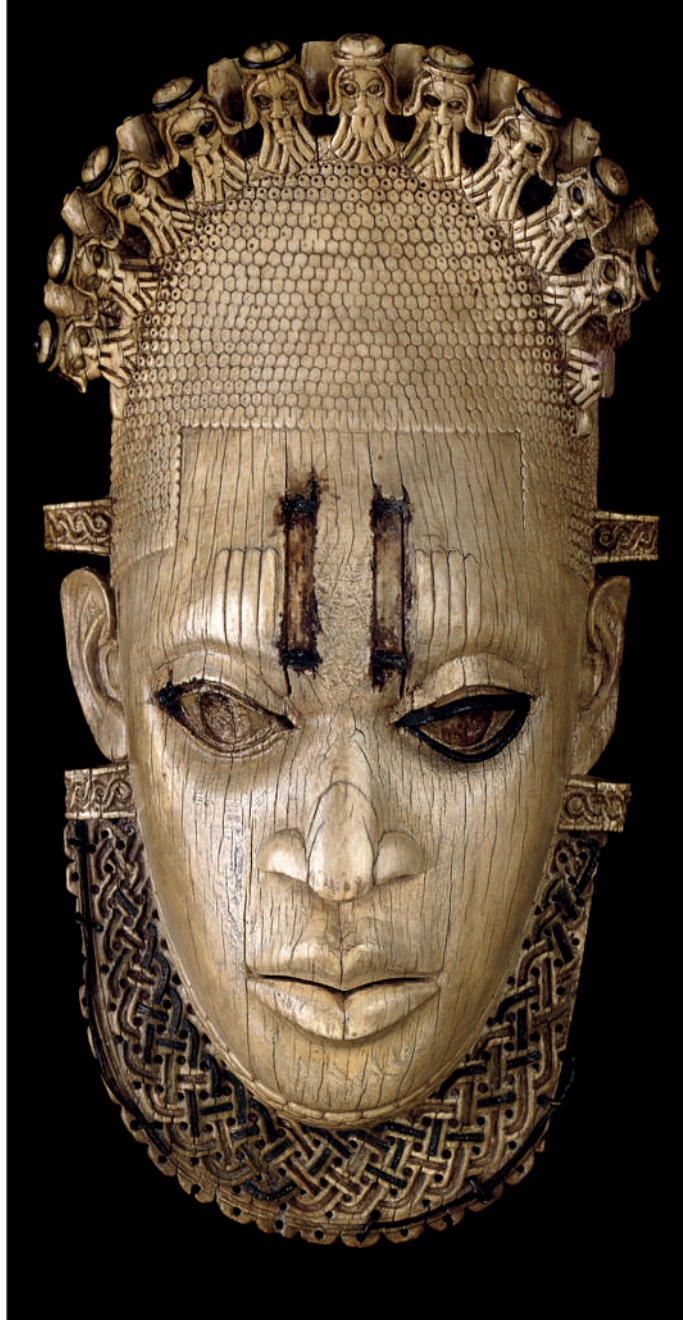
Popoarele edo, Benin, mască de fildes a reginei Idia, sec. al XVI-lea d. Hr., fildes, fier și aliaj de cupru, 24,5 x 12,5 x 6 cm. British Museum, London, Af1910, 0513.1.